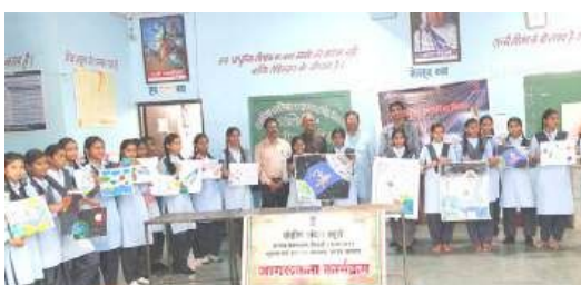
राष्ट्रीय अंतरिक्ष दिवस के अवसर पर छात्रों द्वारा की गई पेंटिंग प्रतियोगिता।